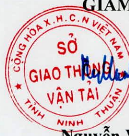
Nguyễn Văn Vinh